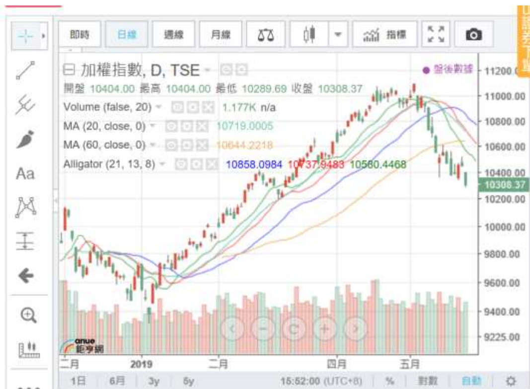
(圖一：問題：台股會從此突然回春直攻 12682 點 ???)

每天國際市場的均衡成交匯率，是不是多是有利於各國的經濟？當然不是。哪個時刻的全球最佳均衡匯率？那應該是各國經濟成長多是最佳(The best)的時刻。那個時候的市場均衡匯率，可能是最穩定的匯率；那應該是全球 GDP 最平穩的時候。IMF 一定有將每天、或是每周每月的全球匯率，做成時間條狀圖，然後會繪製一條移動平均線；這是統計學系大學畢業的基本工作；由這個圖可以檢視全球匯率變化。研究者可以以移動平均線為標準，衡量全球貿易經濟與