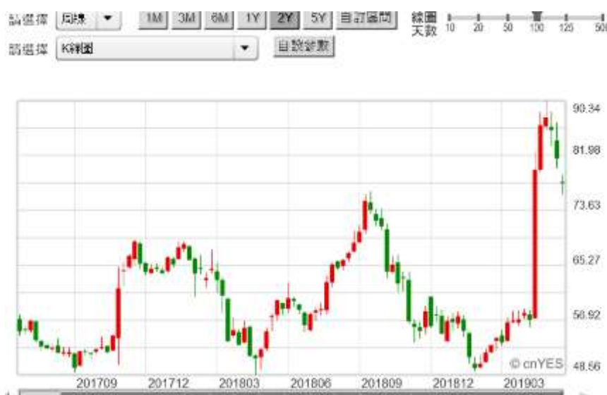
(圖四：高通股價被蘋果捧上來的？，鉅亨網)

媒體或是文字稿多說，現在進入「匯率戰爭」？股市大空、特空？這種發展的確驗證了 IS-LM 的證明？未來川普繼續攻城，只有兩個方向，科技與實所有經濟活動 IS，這兩個部門。科技戰是高手過招，將華為納入國家級戰爭中，是國安層次的；它已經威脅到全面性的國家安全。除非它已經擴散，否則對一些枝節再打下去、事倍功半。美國司法部在 2019 年對華為子公司、與任正非女兒任晚舟控告竊取等 23 項罪名；美國政府還在 5 月以華為為指標，與多數國家會議通過資訊安全通則、國安層級守則；還將華為威脅納入貿易談判重要和解議題。美國對於 5G，或對於華為通訊系統，幾乎已經到驚慌失措地步？它已經遠勝於高通？5G 有藏著全球安全的秘密？