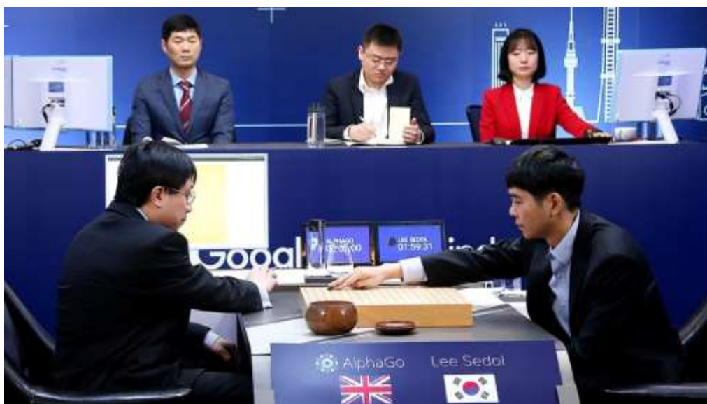
(圖三：人腦與 AI 對奕)

下一波的科技戰該是人工智能 AI，這項科技近期漸漸擺脫，所謂機器人獨立鐵金剛。它結合到農業，可以用科技管控畜牧；它結合到金融業，可以當語音服務天使，加強一般性的產業管理與創新。AI 正開始以大數據智慧，輔助的型態切入各產業，無人車、無人戰機、無人駕駛的客機、與馬斯克登陸居住火星的理想？川普這 8 年兩任真要長期貿易大戰，就與 5G 與 AI，AI 的牽連更大。未來這些想像不到的發展更快；中外產業領袖們大多認為，5G 擴散後、AI 加速發展，將會每 3 到 5 年出現一輪新科技產品。而就以大陸或台灣而言，企業家說與其花費幾十年時間專注、投入幾百億資金從根研究，不如成立併購基金加速進度？時機尚未成熟這些多是說的而已、做得還少。反過來現在現實是，貿易戰爭一定打到 IS 的總量，因此消費者流動性需求會減少，經濟成長受壓抑。但因這項戰爭，影響阻礙到科技發展與投入，因此 I 也受到影響。當 IS 受到一定程度影響後，便會波及 LM 部門；它們是貨幣供給與需求，金融市場利率、匯