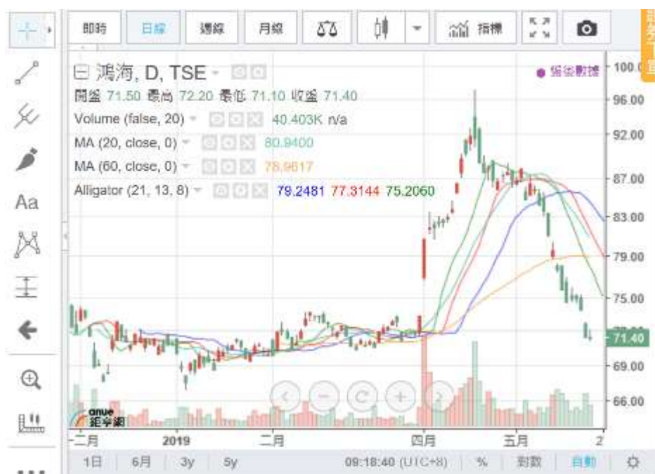
(圖五：全球電子最大代工鴻海股價，鉅亨網)

到目前為止，川普戰爭火力依然集中在 5G，尚未碰擊到 AI 全面；但是全球匯率還在飄搖過海，股價也是自顧不暇。很顯然戰爭延伸到 IS 部門，或說影響 IS 部門的速度遠快於影響科技戰，搞得 LM 部門人心惶惶。因為科技研究需要實驗室、需要時間，股票、債券哪需要這麼多時間去反應？尤其是外資世界熱錢，大概已經成為無頭蒼蠅，到處亂飛一通？一年配 10 元/股股利的績優股，管它匯率是否谷底，連殺 10 幾天；全球最大代工廠、一股 2 美元股價也是殺無赦。最後？過半年之後當然還是無言，因為又是殺錯了？？