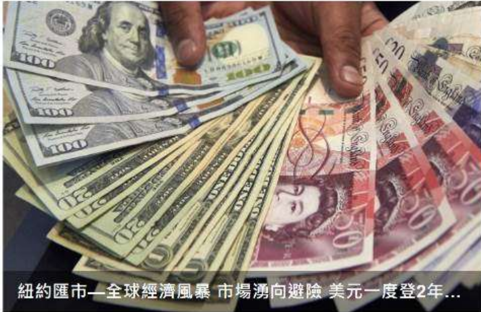
(圖一；匯市動盪，鉅亨網)

每天國際市場的均衡成交匯率，是不是多是以有利於各國的經濟？當然不全是。哪個時刻的匯率是全球最佳均衡匯率？那應該是各國經濟成長速度多是最佳的時刻。那個時候的市場均衡匯率，是最均衡的匯率；那應該也是全球 GDP 最穩健時候。IMF 一定有將每天、或是每周每月全球匯率，做成時間條狀圖統計直方圖，然後第二天又繪製一條，如次持續為長期觀察，若此則容易見到均衡與否。