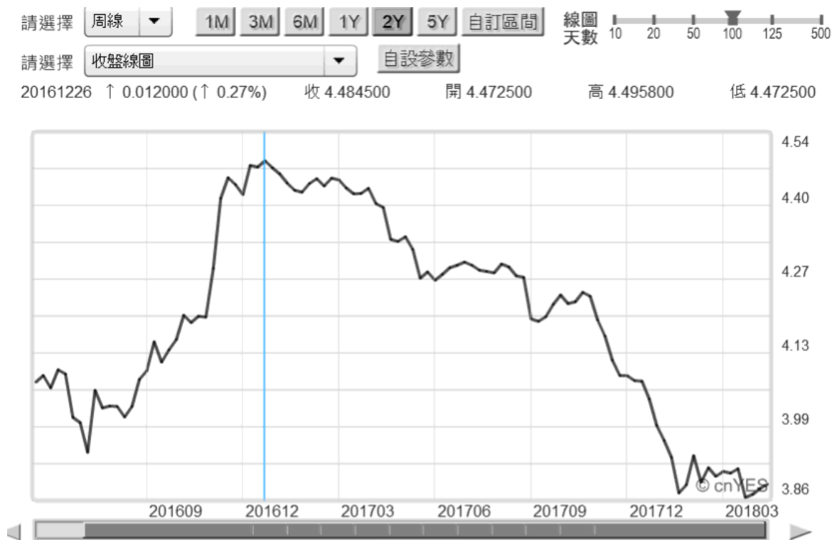
(圖六： 馬來西亞貨幣匯率，吉特兌換美元周曲線圖，鉅亨網)

檢視其貨幣匯率吉特兌換美元趨勢圖形，則是由 2016 年的 12 月 26 日，也就是美國聯準會再度升息次日，由 4.4958 兌換 1 美元、升值到 3.86 兌換 1 美元。這與過去 1997 亞洲貨幣 Herding 貶值，所引發的「亞洲金融風暴」顯著不同。由東南亞股市穩健程度，與兩岸三地的股市相比；這顯然是因為中美貿易戰爭效應單一因素使然。即使這一場戰爭的持續向延續，但股價會先落底反應。川普與習近平多不會因為商業利益，在這場賽局中步入「囚犯困境」；但是另外一面，「納許均衡」當然也不可能一步到位。但往好的這方面發展的信號又是什麼？兩岸多需要東南亞便宜勞力為代工主要供應鏈，但兩岸受到中美貿易戰爭衝擊，它的遞延效果不會影響東南亞的經濟發展；因為大陸企業正在進行供給側改革，而且在科技上是呈現跳躍式成長，具備轉型升級成功要件。美國以高關稅給中國壓力，不會轉嫁到東南亞國家身上？負面效應就在中國與台商就吸收殆盡？