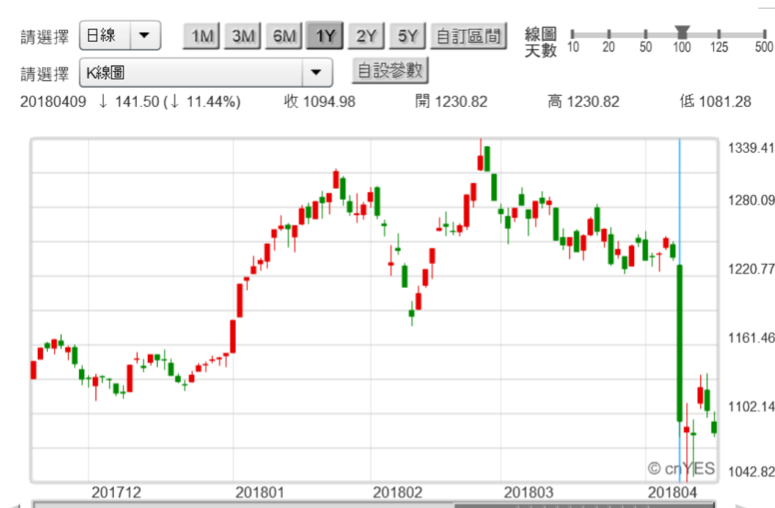
(圖二：俄羅斯股價指數日線圖，鉅亨網)

港股目前也是面臨到這種麻煩，就是與港元聯繫的美元弱；使得很多外資想跑。當然像這種離開多是短暫，因為美元匯率、就是美元指數還是有循環性。因此港股目前面臨窘境解決方法只是需要時間，未來當美元指數升值時，港