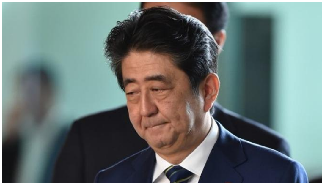
(圖六：日本首相安倍晉三)

在 1980 年美國同樣為解脫雙赤字困境，對日圓匯率與日本 301 大動干戈，戰火持續多年未歇；日本在美國一波又一波攻擊下，根本沒有提出積極對策；終於陷入長期通縮。這次美國對手是中國大陸，所不同的是它是一個，極權而且非常有效率國家。習近平在中國的權力地位已是穩如泰山，尤其是歷經反貪腐肅貪考驗後，竟然可以在 18 大之前動盪，轉為 19 大穩如泰山。這必然是習近平的能力，鎮定與思考及布局；這些能耐超乎外界政治專家所能想像。被中央政治局反貪腐小組所「雙規」的官員，幾乎多是部長級以上的政治老將，這些人不會進行反革命「反撲」？而在經歷這種政治整肅後，在 19 大中全身而退；同樣局面會出現在中美貿易對奕上？現在表面上是劉鶴主導的第一線戰場，習近平在後方是以逸待勞？總書記國家主席的思維是什麼？而美國當時面對的日本是一個政黨政治，意見紛雜、民粹亂政、最後終於敗下陣來；首相一個又換一個多無法解決，去抵擋美國貿易攻勢；這種亂局直到道安倍晉三重新再次上台為止。