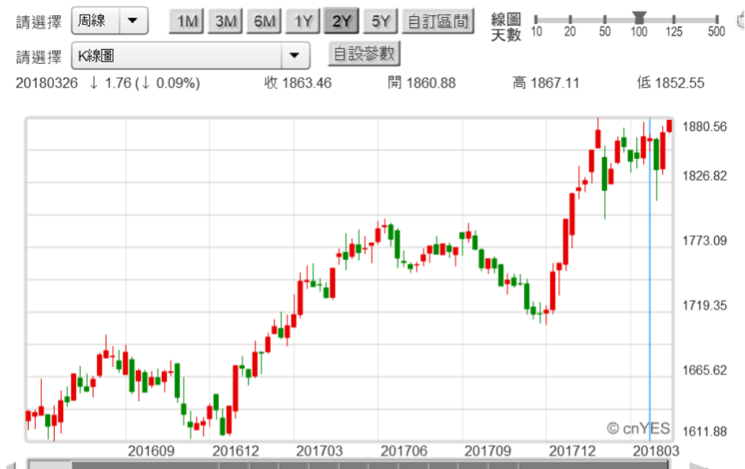
(圖五：馬來西亞綜合股價指數，鉅亨網)

而新興市場股災不是多從東南亞發動？以中國大陸國際經濟合作，「一帶一路」版圖檢視發現；東南亞國家中、印尼與馬來西亞股市與貨幣匯率，就與台股或是港股有所不同，目前股市仍然是多頭攻勢，而匯率也是還處於升值後高檔。雖然中國大陸是「一帶一路」主導國家，但東協各國股市趨勢，多比中國上證股價指數強勁。以周 K 線圖檢視，上證股價指數的弱勢顯然是，中美貿易酣戰未歇、你來我往、互不相讓。而人民銀行在 2018 年 4 月 18 日，突然宣告降低存款準備率，也是為未來系統性風險的預防鋪路；它可能是見到利率升高後，企業去槓桿必要條件就是資金適度寬鬆。人民銀行刻意選擇在上半年美國商務部，對貿易對手國匯率調查公告後，進行存款準備率調降；基本上就不是針對人民幣匯價，不是要透過「利率評價」去影匯價。人民銀行見到的未來，可能還包含預估到未來美元指數升高，所帶來對大陸企業外債的風險等等。