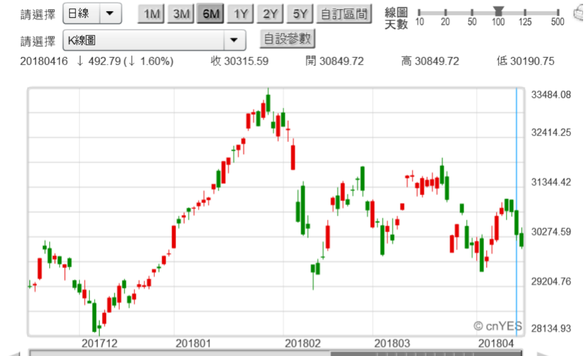
(圖一：香港恆生股價指數日 K 線圖，鉅亨網)

如果現在還繼續在評估，中美貿易對股市系統性風險；那就有點落後了。近期多是個股、或是匯率貶值偶發性系統風險。由於投資人對新興市場畏縮，台股與港股也分別因為匯率貶值而大跌。台股於 2018 年 4 月 17 日，加權股價指數大跌 144.1 點，收盤時為 10,810.45 點。而港股則於 2018 年 4 月 16 日，恆生股價指數大跌 492.79 點。前者很顯著是因為，新台幣兌換美元匯率連續性貶值；而後者是因為港元與美元固定連繫。因此當美元持續弱勢；港股多頭誘惑當然降低。對於這兩種情境的處理，會出現固定匯率下，升息無法挽回國際資金；也就是「歐元之父」孟岱爾所言，「浮動匯率制度」才可以隔離「外部效應」。港股與港元近期表現，顯然驗證國際經濟學大師匯率制度假說。因為對投資機