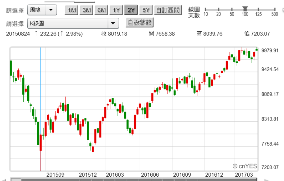
(圖六：台股加權股價指數周 K 線圖，鉅亨網首頁)

若將比對範圍縮小為三種貨幣，則人民幣兌換美元貶值，的確觸動兩岸資金移動；大陸資金、或人民幣轉進新台幣。雖然亞幣全部升值，但至今以新台幣匯率最強勢。這是因為中國大陸也認定，新台幣兌美元被低估？檢視多數亞幣的長短期趨勢時會發現，近期以新台幣兌換美元升值屬強中之強；台幣成為金融界口中「地表最強勢貨幣」，主因應是來自對岸中國大陸人民幣青睞。人民幣兌換美元起貶於 2014 年 2 月，但兌換新台幣貶值趨勢則始於 2015 年 9 月。這個時間點也是台灣股市觸底時；最低加權股價指數 7,203.07 點。但此時間點卻也是上證股價指數急行軍後的最高點；台股與上證、一個到底、一個到頂、互動關係是逆向的。前言所述人民幣兌換新台幣貶值，就是自 2015 年 9 月開始；陸資是藉什麼管道轉為新台幣？再進到台灣股票市場中？而在 2015 年 6 月上證股災大跌後，它並未隨新興市場，於 2016 年 1