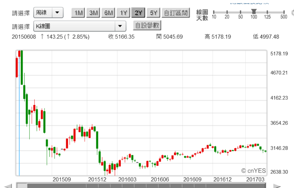
(圖七：上證股價指數周 K 線圖)

月觸底強勁回升；但台股指數就從 2016 年 1 月 19 日揚帆。最大可能原因是中國陷入，史上最大金融不良債權清理。