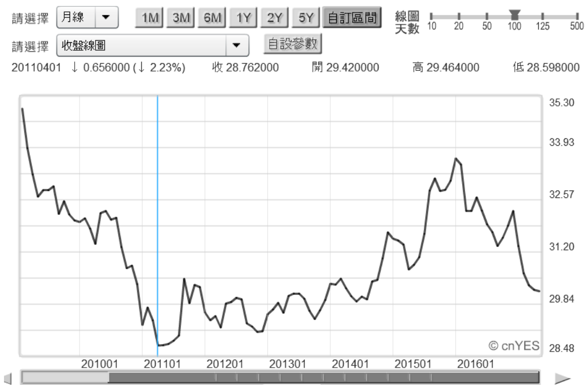
(圖三：新台幣兌換美元月匯率曲線圖，鉅亨網首頁)

亞洲貨幣匯率多像新台幣這樣強勁？在 2016 年 12 月 15 日、Fed 二次升息後，以大利空出盡姿態；披星戴月、日夜攻堅？由新台幣兌換美元月曲線圖，在 2008 年後最強勢新台幣，時間點出現在第二次美元 QE 宣告後；即 2011 年 4 月初、價位為 28.59 兌換美元。回顧當時背景，在預期最多 QE 只會做三次，最終將停止下；新台幣匯價開始回貶，最低價位為 2016 年 12 月 15 日、33.838 兌換 1 美元。但此後亞幣與台幣這次第二度回升，速度之快出乎預料；尤其是此不到半年期間，直接攻到 29.94 兌換 1 美元、過關斬將如入無人之境。