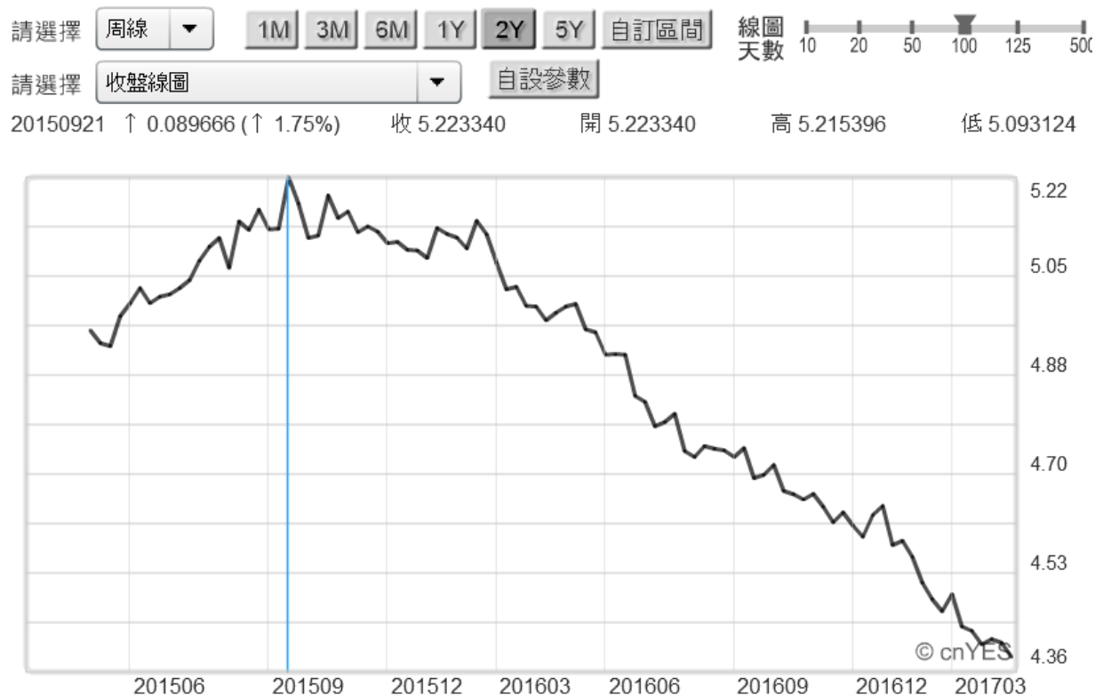
(圖一：新台幣兌換人民幣匯價曲線圖，鉅亨網首頁)

人要成功其實也不必刻意學習他人優點；上帝造人、菩薩養人，智商本來就有差異。每個人要走的路、要受的苦多不一樣；不要跟自己過意不去。只要非常清楚知道自己缺點，而且耐心有心改過來、就絕對不會虛度今生今世。要照見自己缺點的確不易，但從多方面交叉比對就可見到。這波新台幣匯率如此強勢，背景與原因眾說紛紜；從中國地方政府對台