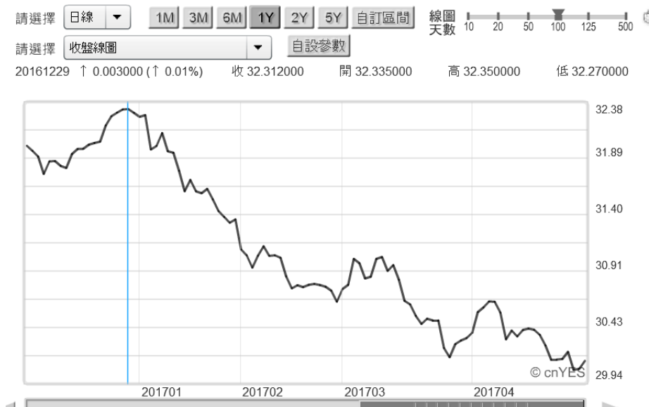
(圖四：新台幣兌換美元日曲線圖，鉅亨網首頁)

這波升值與 2011 年不同的是「速度」，多數台灣企業負責人將此歸因於 2017 年 4 月 15 日美國對貿易國匯率調查報告。但由升值型態比對，2011 年是眾亞幣群聚現象、東南亞貨幣與新台幣趨勢一致；而自 2016 年底後與這波台幣與亞幣也亦步亦趨。以台幣匯率短期趨勢，自 2016 年 12 月 32.38 兌 1 美元急升到近期、不斷試探 29.8 兌 1 美元。前半期是反映，Fed 在同年 3 月 15 日第三度升息；與美國商務部在同年 4 月 15 日，對貿易對手國匯率操縱指控；亞幣群聚走勢升值。唯本文認為，下半期間或未來若尚會持續升值原因，會落在中國金融信貸風險未除的變數中。自 Fed 將停止 QE 政策，美元指數開始起漲於 2014 年 9 月，當時指數位置為 79.775 點。美元指數起漲後，預期 Fed 由鬆轉為中性政策，觸動一波亞幣貶值；一路貶值到 2015 年 9 月中。由泰銖兌換美元匯率曲線圖見到升值趨勢，也同樣在 2016 年底後，泰銖兌換美元再次升值。