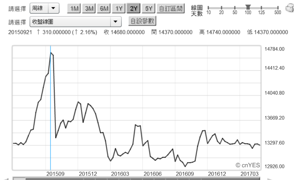
(圖八：印尼盾兌換美元匯率曲線圖，鉅亨網首頁)

概觀亞幣除泰銖外，印尼盾兌換美元匯率也在 2015 年 9 月起升值；但 2016 年底後、這一波就沒再跟進；其升值趨勢落後於新台幣及泰銖。若 Fed 政策有效，中國的確也將印尼列進一帶一路，人民幣流轉為印尼盾應是未來之必然。唯這關鍵會是中國與任何一帶一路往來，將是以何種貨幣計價去談雙方基礎建設。以歷史經驗，對東南亞國協投資最大風險有兩大項，一為政治排華、二是匯率風險；中國可運用 ASEAN 共同市場模式處理政治問題，但這些國家匯率風險卻仍然取決於美元，這還是為未來短期無可改變之事實。(提醒：本文是為財金專業研究分享，非投資建議書；不為任何引用本文為行銷或投資損益背書。)