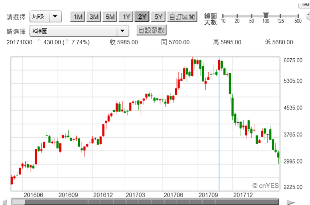
(圖一：台灣大立光公司股價最高峰是 2017 年 11 月，)

一、在金融研究所的 BEI「經營指標」中，2017 年第二季的冷漠，有異於 Fama & French 兩位財務大師「效率市場理論假說」(EMH)。因為當時台灣股與匯市多是趨勢強勁，但是社會媒體與大眾對於萬點的台股不以為意，一般社會大眾多沒賺到股票的錢。這也難怪為什麼 80% 台積電公司的股權全被外資持有；該季 BEI「經營指標」的滑落速度相當快。二、指標強烈顯示，2017 年第二季時，台灣整體金融業務的擴張，處在一個停滯的調整階段；這也極有可能是對美國央行 Fed 貨幣政策，將進行最嚴峻的「縮表」緊縮貨幣政策，所產生的預期效果收縮融資行為。當然這可能在股市盤整時，理財的標的轉到房地產時發