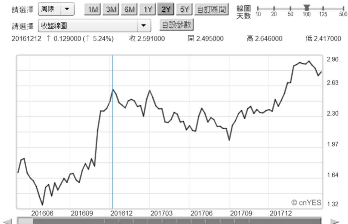
(圖四：美國 10 年期公債殖利率周曲線圖，鉅亨網)

因為此時 BEI 的「市場指標」已顯著滑落，但是 BEI「經營指標」也就是業務擴張卻是突破新高；興奮到最高點、創下 68.6 點最高指數。「市場指標」就是實體經濟，它會有循環性「反應過度」(Over Reaction)特性；而「經營指標」對景氣趨緩反應遲鈍，對於景氣擴張也落後反應、或是「反應不足」(Under Reaction)；相對於「市場指標」的預期效應、「經營指標」是 Sell Side-而非 Buy Side。一、BEI 的「經營指標」顯示，這些 CEO 的行為似乎是被動與保守；景氣明顯見到轉佳才敢動手擴張放款業務。在 2017 年第二季時市場氣氛已經轉差，但經營者卻是以緩慢步調下降調整。而在 2017 年 11 月景氣、或說市場氣氛已經顯著攀高，但「經營指標」數值卻從 64,9 點，掉到最谷底的 52.9 點。二、由 BEI「市場指標」觀察，它多是持續性起伏，一波比一波高；但是 BEI「經營指標」卻像是在 2017 年 11 月，大立光股價快要留滑梯時才異常熱絡，這顯然是與台股股市的短期現象一致。當時是台股加權股價指數科技類股的最高峰，台股股王大立光與鴻海股價最高點多在當時。