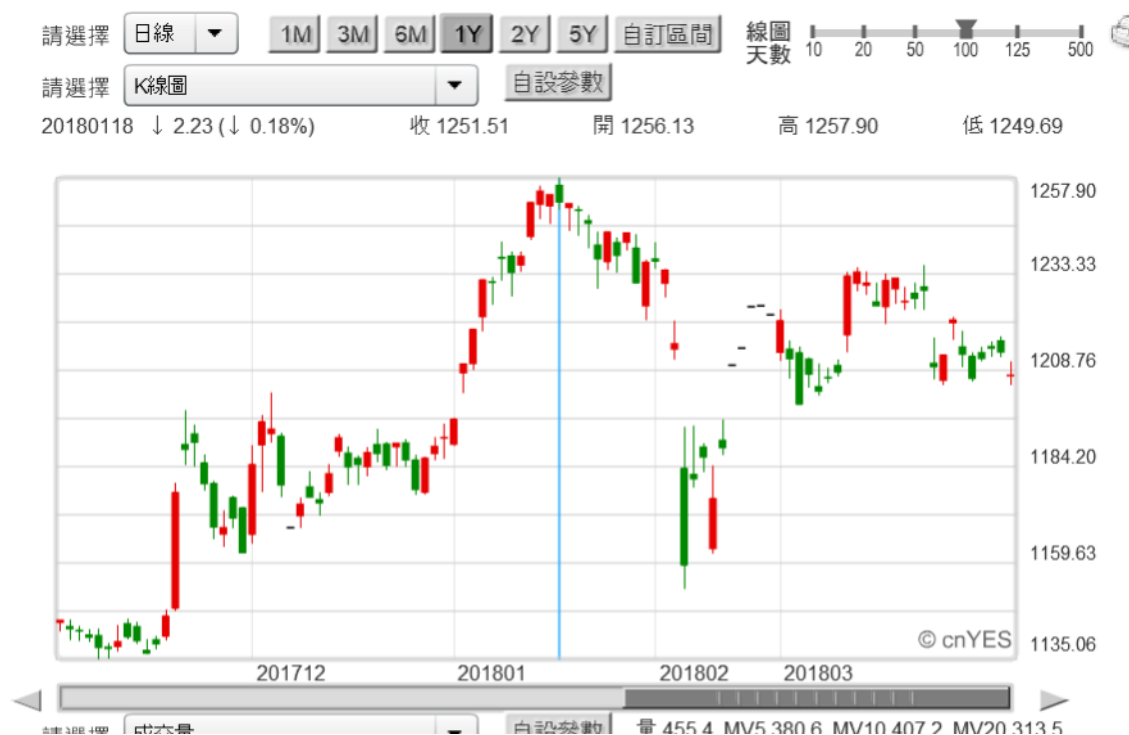
(圖五：台股集中市場金融類股指數日 K 線圖，鉅亨網)

被 BEI 指標的「經營指標」列入，首項觀察項目的即為利息收入，而這項收入包含利差，金融業以存款人委任資金，買進的國際與台灣政府公債定期利息收入。這相對於「經營指標」上所採用的台灣、美國、中國大陸等國國債殖利率變化互相輝映。但本文要提醒，在這幾個國國債的交易中，以台灣政府公債交易周轉率是最低；次級市場的交易並不熱絡，因此呈現自 2016 年初起，在外資入場與本國金融機構常態性買進下，台灣 10 年期公債殖利率，緩緩下降至今仍然未歇止，呈現外資資金持續流入趨勢。在台外資沒撤退，國內金融機構也不知道，在 Fed 縮表下、不買公債如何操作還能是穩賺不賠。在此項各國政府公債殖利率指標中，美國 10 年期公債殖利率應該是最有流動性，它的均衡價格最具利率趨勢參考性。