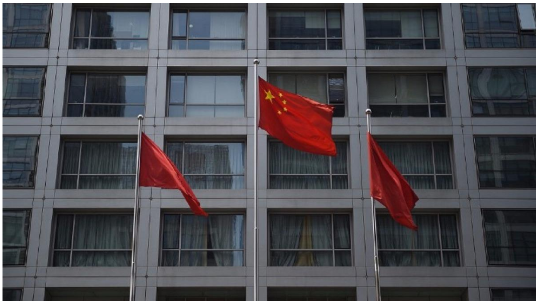
(圖三：宣告執行反貪腐的中共中央政治局)

用圍堵與武器競賽策略勝利。以同樣的競賽邏輯辨識 2008 年之後，現在美國對手已是中國經、貿、軍強權。雖然在尼克森時代，中國就已不是美國主要的敵對國家。但在競爭意識形態上，資本主義的邊際效益出現瑕疵；尤其由資本主義再邁向福利經濟之路後情勢急轉直下，歐洲主權債務危機風暴，就讓資本主義邊際效益呈現遞減。對於 1989 年鄧小平經濟改革成就，美國多數經濟學家剛開始多懷疑，這種爆發性經濟成長到底還能撐多久？2008 年後著名投資銀行經濟學家羅比尼，至今還不斷對中國經濟喊出「完美風暴」；就是認為中國經濟將在債務纏身、資產泡沫、極權貪腐之下步入「硬著陸」。至少會出現類似 1985 年日本通縮世代、或是蘇聯共產解體、或東歐共產黨垮台。羅比尼在金融投資、總體經濟、政治體制，對中國大陸完美風暴觀點，儼然就是修昔底德思想宣示。但是這一切多被中共，經濟或是政治體制破解。攜帶著舊包袱的中國傳統產業，依然可以在幾次「供給側改革」、與跳躍式科技學習中成長；一邊拆掉舊房子，一邊可以就地蓋新房子。