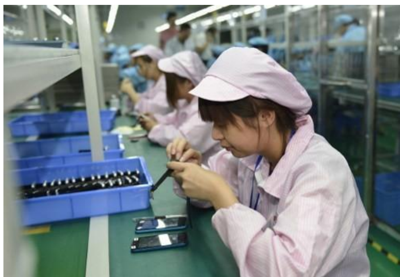
(圖一：中國 2015 年提出工業 2025 計畫)

「修昔底德」是指在國際政治理論，與軍事「恐懼」與「利益」的取捨與糾纏。其實就是「現代投資學理論」，馬可維茲「效率前緣曲線」下「風險」與「預期報酬」的選擇與糾葛。美國現在需要冒著與中國經濟、政治、軍事的翻臉風險，但又要從中國身上攫取經貿與政治利益。至 2018 年 6 月初為止，中美貿易談判已三次交鋒，情勢顯示美國對中國工業 2025 針對性越來越強；似乎不達目的不放手。美畏懼中國工業 2025 原因，來自中國共產黨國家治理團隊穩定，及根本沒有經濟硬著陸跡象出現；如果不做出阻擋策略，10 年後美企業可能就要與國企正面廝殺。