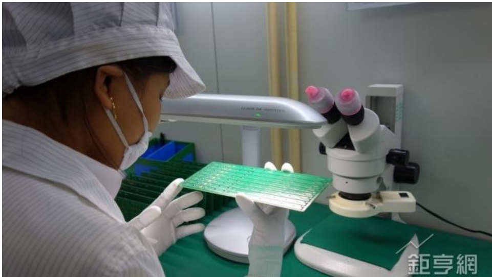
(圖二：中國會領先 5G 世代？鉅亨網)

中國國務院這項規劃顯然已擺脫，所謂社會主義第十三、或是十四「五年計畫性經濟」。更令美國緊張的是，在 18 大共產黨會議中，通過中共政治局反貪腐行動；至今已將極權解體、與經濟硬著陸風險引信幾乎完全拆除。從 18 大持續到 19 大這段期間中，習近平團隊政治與國家治理氣勢越趨強大，且運作手法更趨穩定。2017 年 19 大，中國共產黨上下更通過習近平可以不按照舊例，無限制續任總書記與國家主席、軍委會主席等。在這種經過整肅團隊運作下，2025 年中國產業發展，競賽壓力會令美國更難以抵擋。習近平可以無限期續任後，讓美國經貿官員神經緊張。