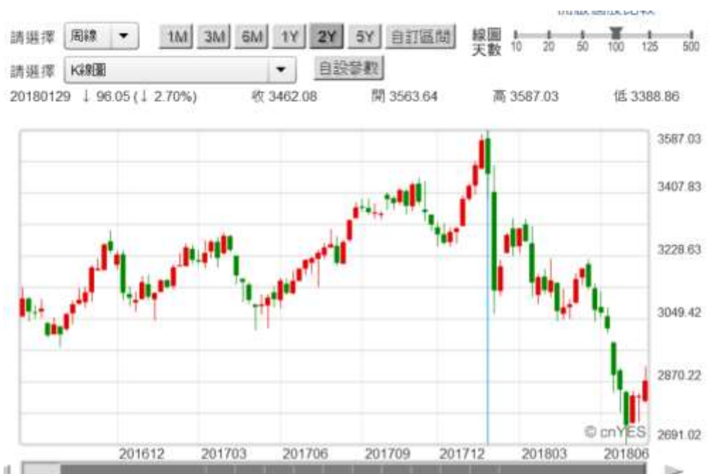
(圖四：中國上證股價指數觸底)

黨總統候選人希拉蕊還呼籲雙方，偌大的太平洋絕對可以容納兩個超級大國。但 2016 年後雙方對立仍未鬆弛，2018 年 2 月 27 日終於引爆雙方經濟全面戰爭。檢視美國股市的發展趨勢，非常清楚地告訴我們，這一場貿易戰爭對美與中國股市多是利空；尤其是中國股市在大跌破底後陷入整理。以適應性預期(Adaptive Expectation)觀點，未來的情勢似乎還是不樂觀。但如果以賽局理論與理性預期(Rational Expectation)觀點，美對於中國貿易的第一波攻勢，將在 2018 年第三季 10 月底，國會議員期中選舉前結束。而這個結束的信號，應該就是人民幣升值。