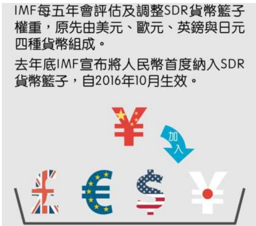
(圖二：人民幣要成為準備貨幣先驅)

而自 1990 年經濟發展產，台灣產業生產條件改變之後，出現外移到中國大陸潮流。當時的中國正處每年兩位數以上，經濟成長率與規模飛奔之際；台灣產業外移方式，多是產業龍頭廠商率隊。而所有各種產業垂直供應鏈小廠，跟隨大廠一個接著一個西進中國。台商先是攻入深圳、廣東、蘇州一帶，繼而是武漢、成都、重慶等；最後則幾乎是遍地開花。2008 年史上最大金融海嘯之後，中國大陸經濟生產規模還是日益龐大，在 2012 年躍升為全球第二大經濟體。並且以尚未真正放緩速度與幅度，繼續不斷複合成長；預估到 2025 年之後將逼近美國 GDP 規模，可能在 2035 年後超越美國成為全球最大經濟體。中國產業為取得專業技術的擴張與全球化投