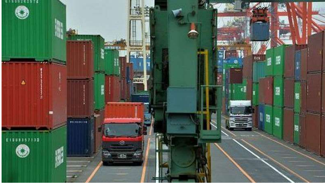
(圖一：全球化浪潮面對川普保護主義要越戰越勇)

2018年8月4日(上週六)，傳聞中國商務部將分細項產品，擬定對付美國關稅方案、對美國關稅戰爭大力還手。如果不計入1985年「廣場會議」，美國對付新興國家、日本經濟崛起的貿易戰爭。這次自2018年2月27日，川普簽署「中國經濟侵略備忘錄」前後開始，美國率先開啟貿易保護行動意識；這是自從1990年日本經濟泡沫化後，再來一次鋪天蓋地的反全球化最大浪潮。自1995年前後「世界貿易組織」(World Trade Organization)成立後，全球各國多希望能夠藉由亞當斯密斯「比較利益」(Comparative Benefit)的多方交換，使本國與全球其它各國經濟；個別與總合的福利多達到最高峰。也由於全球化潮流在1999年，歐元問世整合後、投資浪潮席捲歐盟。以OEM或是ODM代工為主的台灣業者，為了達到高效率的產品組裝，開始所謂「全球化佈局」(Globalize)。而做為美國領導廠商的