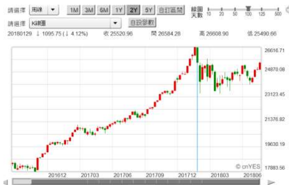
(圖三：道瓊工業股價指數周 K 線圖)

資、大手筆併購等引發新興國家矚目；並使工業化國家側目。現任日本央行總裁黑田東彥，2003 年就在法國巴黎投書，闡述中國經濟崛起，人民幣匯率已經嚴重低估；要求與建議 IMF 改革 SDR 制度。將人民幣納入 SDR 準備貨幣中，並且請 IMF 要求人民銀行，進行人民幣貨幣匯率交易制度改革。2012 年歐洲主權債務危機期間，人民銀行數度為維持歐元區經濟體健全與穩定，順應德國總理梅克爾要求，買進希臘等國國債；讓歐洲國家債券價格崩跌情勢暫時歇息，中國也是美國國債的最大持有者。