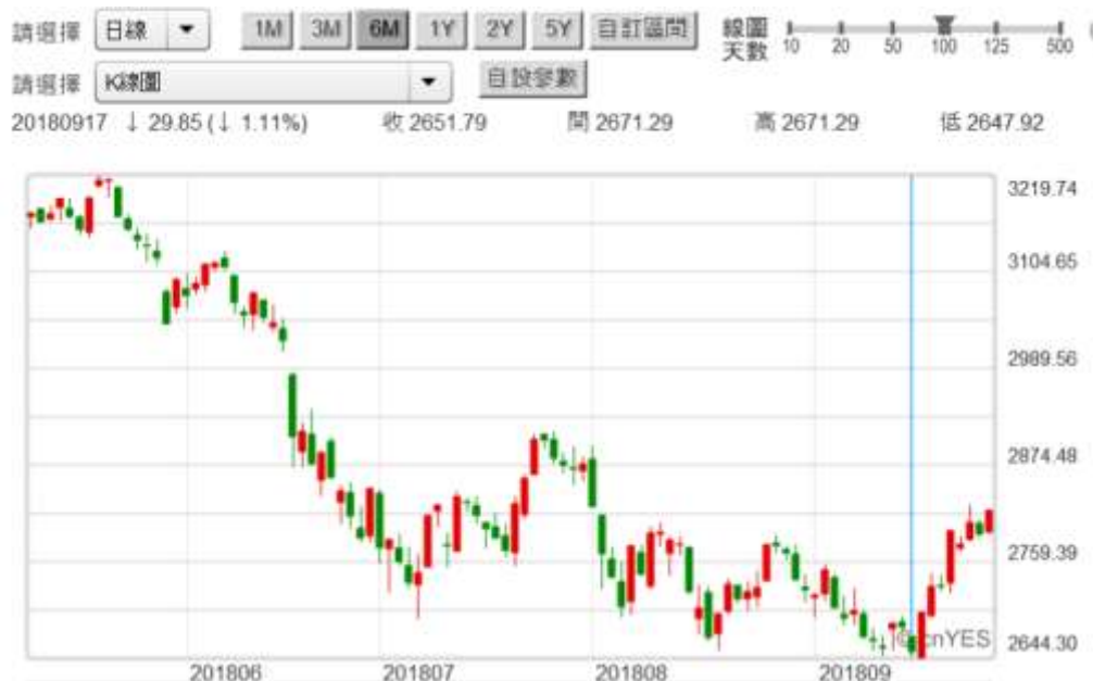
(圖三：上證股價指數日 K 線圖)

如果美元指數不再上揚，人民幣最大貶值水準就在這水準；則 2018 年 9 月 17 日 Fed 會後決議文，就是最強勁的利空了；又是經濟一片大好。這打造出來的上證股價底部區，指數是 2,651.76 點。Fed 主席說，失業率低到 3.9%、GDP 成長率亮麗、有通貨膨脹隱憂？這不就是暗示，Fed 的緊縮貨幣政策，將會出乎預料之外強勁？於是公債殖利率開快「秀煙火」。這時人民幣匯率，應該面對外部風險最大時候；只要中國第三季經濟成長率，維持穩定、不會人頭落地。人民銀行就不會再鋪設軟地毯；則離岸人民幣匯率就不會再被砍。2018 年 9 月 17 日，就是全球最大新興股市落底的起跑點。只要上證不會再被砍下來，則全球新興股市自然停止暴跌。