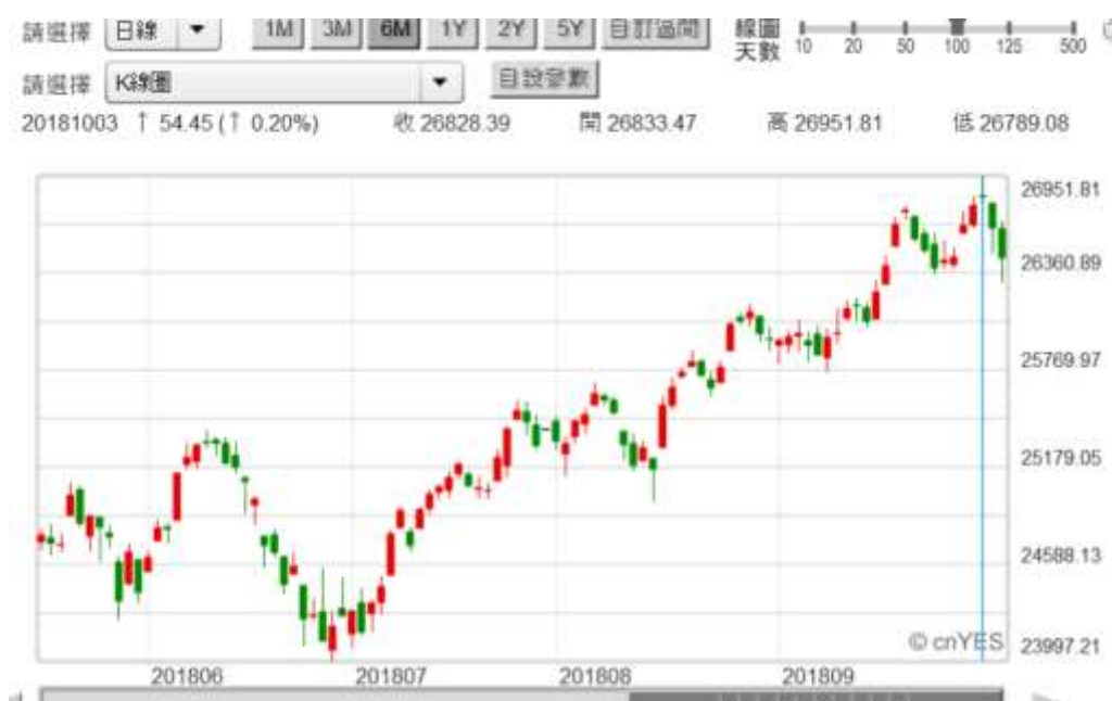
(圖四：道瓊工業股價指數日 K 線圖)

只要貿易戰爭持續，共和黨在眾議院的席位，可能難以成最大黨；選完後、川普就可以準備休無薪假了。需要注意的是美股在 11 月 6 日前多空趨勢，以政治專家的語言而言，多是在對川普政策投票；這跟 2018 年 10 月之後台股也一樣，多是在對執政黨執政成果驗收。如果美股在 11 月 6 日跌跌不休，那川普共和黨優勢可能喪失一大半；執政不到兩年就把完全執政局面弄壞。那 2018 年底川普就準備去休「無薪假」了。美國財政出現真的懸崖；耶穌基督「阿們」，善哉伯南克主席話應驗了。近期美國 10 年期公債殖利率，站在 3% 以上、閉著眼睛往上衝，針對的不是財政問題，不是緊縮政策問題；看股價請用專業，不要搞