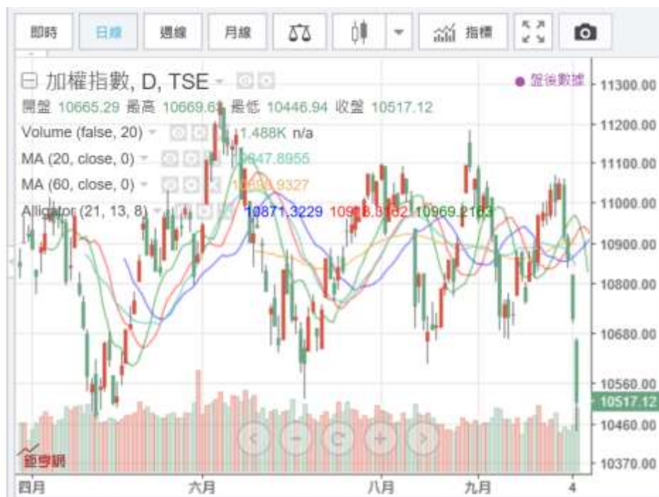
(圖五：台股加權股價指數日 K 線圖，鉅亨網)

在台股的思維中，2017 年 12 月 13 日股市高檔，被認為這就是這波空頭的開始；現在認為萬點是常態的說法，可能會被認為是瘋了；尤其是認為這是上攻歷史高點的底部區，那可能是發高燒。可是股市的上揚或是下跌，多是因為未來情勢未被預期到，出乎預料之外、才會出現崩盤或是大漲行情？檢視台股集中市場融資餘額，連融券者多在減碼；資券餘額同步退出，既無多方攻勢、又無融券回補，依照標準的技術分析，難道這不是短期、將會急跌的行情？