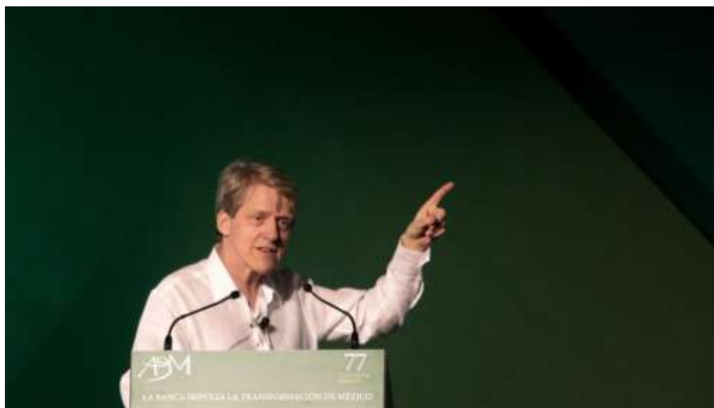
(圖一：Robert Shiller；Sir 您看過「大蕭條」？鉅亨網 AFP)

2018 年 10 月 2 日，全球新興市場貨幣匯率、突然又再一次大貶值；當天台灣集中市場，外資賣超股票額度顯著；新台幣兌換美元匯率顯著貶值。過去半年以來美國 Fed 政策，美國貨幣債券市場均衡利率，GDP 高成長率及通貨膨脹等，成為全球金融市場關注焦點；其中最大影響權重是在於匯率，就是要命的美元指數。短線的國際投資，有價證券「需要報酬率」只要 6%。因此對匯率變化特別敏感；因為價差獲利設定目標本來就不大，如果不幸被該國匯率貶值侵蝕；則無異白忙一場。2018 年 10 月 11 日，台股加權股價指數崩跌；使得多年來看長空、說泡沫者鬆一口氣。