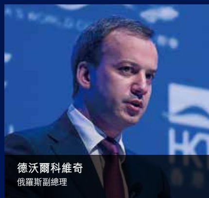
德沃爾科維奇 俄羅斯副總理