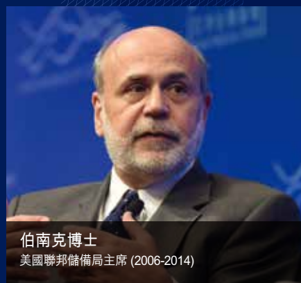
伯南克博士 美國聯邦儲備局主席 (2006-2014)