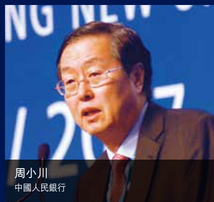
周小川 中國人民銀行