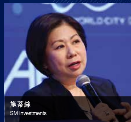
施蒂絲 SM Investments