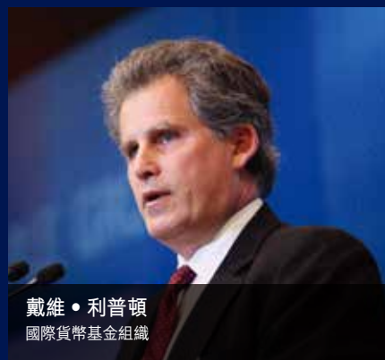
戴維·利普頓 國際貨幣基金組織