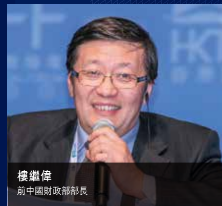
樓繼偉 前中國財政部部長