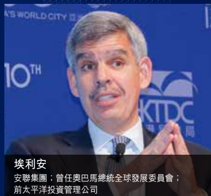
埃利安 安聯集團；曾任奧巴馬總統全球發展委員會； 前太平洋投資管理公司