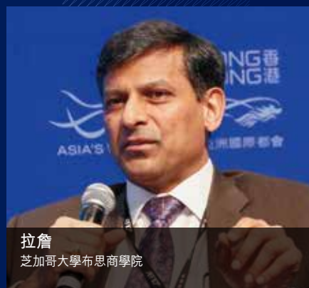
拉詹 芝加哥大學布斯商學院