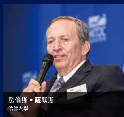
勞倫斯·薩默斯 哈佛大學