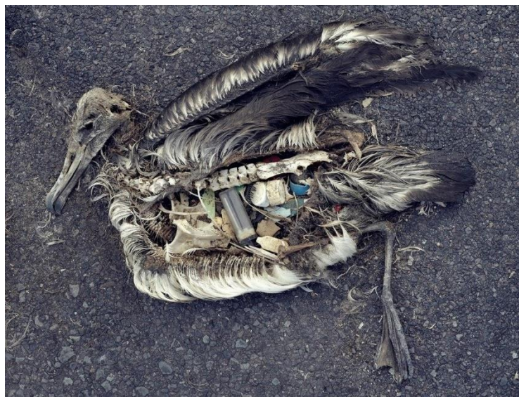
中途島信天翁的「腹中物」