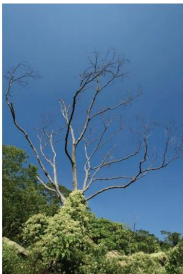
樹木底座被小花蔓 澤蘭覆蓋