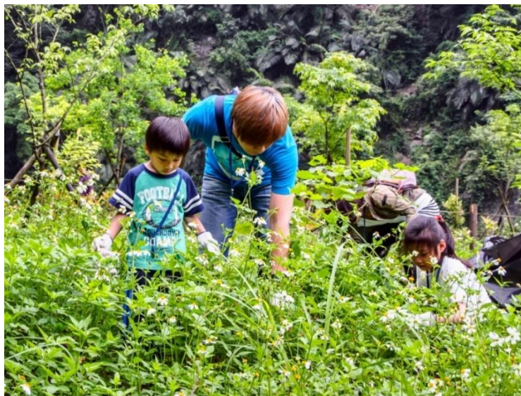
生長力驚人的大花咸豐草