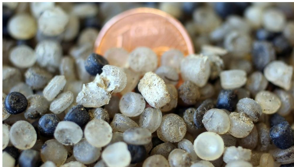
海洋中的塑膠微粒已經進入我們的食物鏈